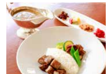
EUROPEAN BEEF CURRY WITH CUBED STEAK RICE サイコロステーキの欧風ビーフカレー