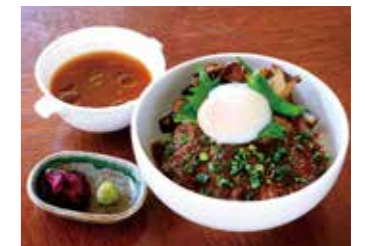
BEEF SIRLOIN STEAK OVER RICE ( WITH SOUP ) 牛サーロインステーキ丼 (スープ付)