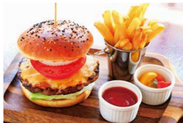
R. H. B. B. (ROSE HOTEL YOKOHAMA BEEF BURGER) R. H. B. B. (ローズホテル横浜ビーフバーガー)