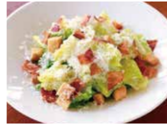
CAESAR SALAD シーザーサラダ