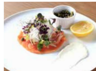
MARINATED SMOKED SALMON スモークサーモンのマリネ