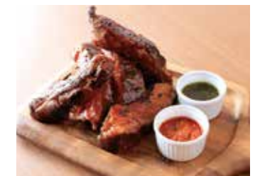
BBQ BACK RIBS WITH HOISIN SAUCE BBQ バックリブ ホイセンソース