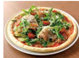
PIZZA WITH ASPARAGUS, PROSCIUTTO AND ARUGULA アスパラガスと生ハムとルッコラのピザ