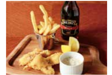
FISH & CHIPS WITH HOMEMADE TARTAR SAUCE フィッシュ&チップス 自家製タルタルソース