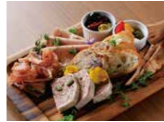
ASSORTMENT OF CHARCUTERIE シャルキュトリー盛り合わせ