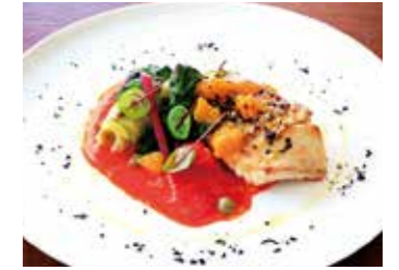
SAUTEED FISH OF THE DAY 本日鮮魚のソテー 本日の調理法で