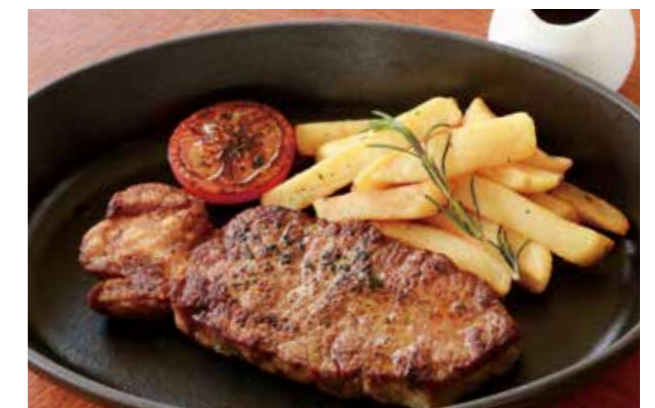
SIRLOIN STEAK (225G) 放牧牛のサーロインステーキ (225g)