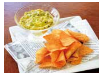
AVOCADO DIP & TORTILLA CHIPS アボカドディップ&トルティーヤチップス