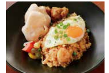
MILLY STYLE NASI GORENG ミリー特製 ナシゴレン