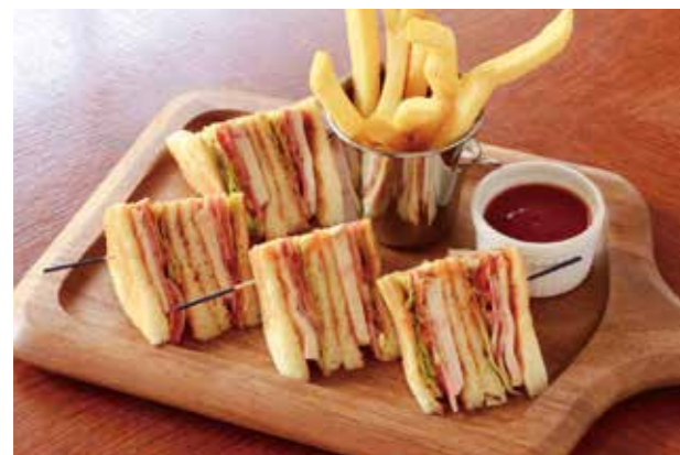
CLUB HOUSE SANDWICH クラブハウスサンドイッチ