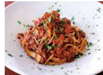
BOLOGNESE SPAGHETTI WITH MUSHROOM キノコ入りボロネーゼ スパゲッティ