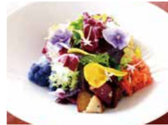
KANAGAWA VEGETABLES GARDEN SALAD 神奈川県契約農家のガーデンサラダ