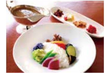
VEGETABLE COCONUT MILK CURRY ベジタブルココナッツミルクカレー